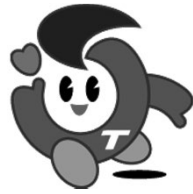
シルバー人材センターのイメージキャラクター 「シルバーくん」